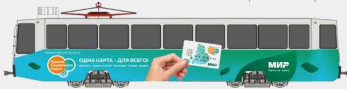
Социальная карта Свердловской области