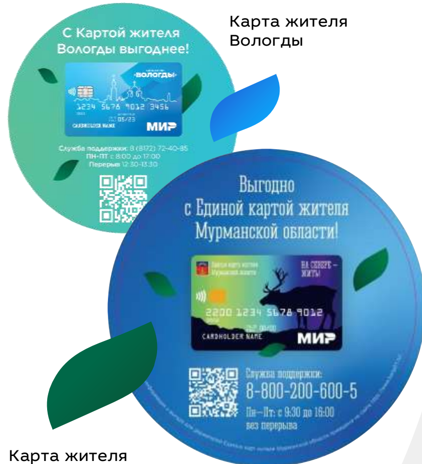
Карта жителя Мурманской области