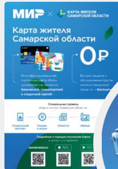
Карта жителя Самарской области